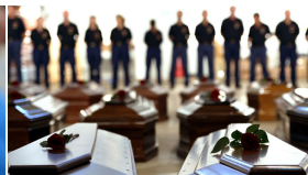
Violents incidents à Rio (http://fr.canoe.ca/infos/galleries_photos/2013/10/20131008135650.html)

(http://fr.canoe.ca/infos/galleries_photos/2013/10/20131008135650.html)