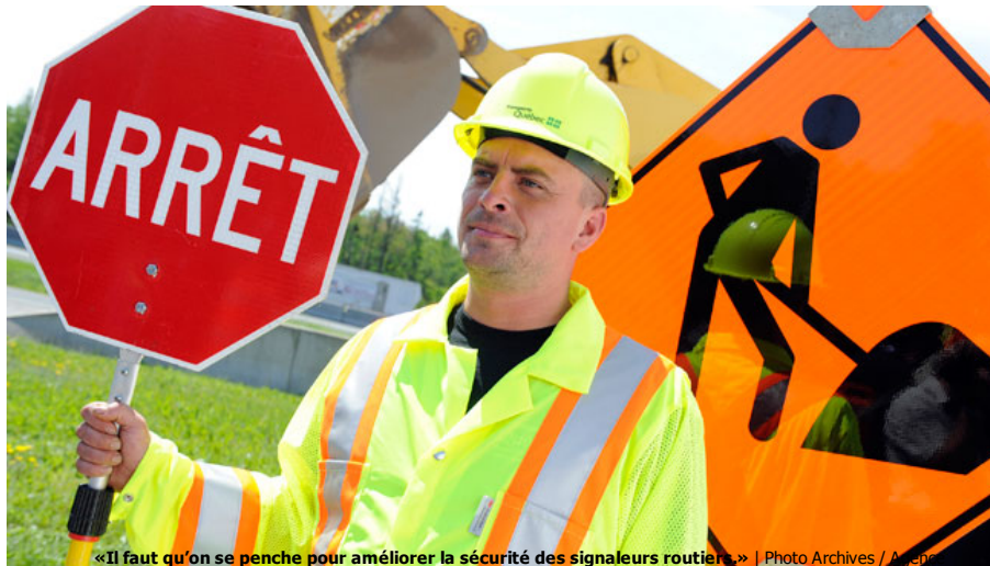
«Il faut qu'on se penche pour améliorer la sécurité des signaleurs routiers.»